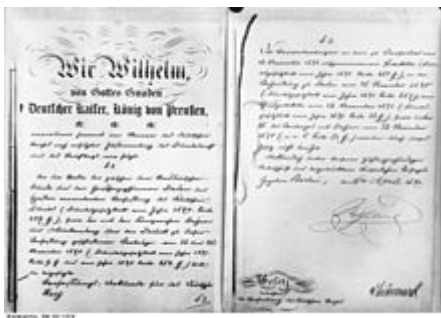
Erste und letzte Seite der Verfassungsurkunde von 1871