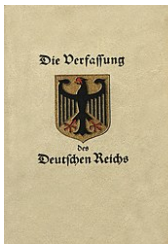
Bucheinband der Verfassung der Weimarer Republik von 1919

Weimarerer Republik-Verfassung ist keine Reichsverfassung, sie ist auch keine demokratische Verfassung, da diese durch einen Putsch, Verfassungshochverrat, Wahlbetrug, ein Nichtverfassungsorgan und dem Hochverrat am Deutschen Volk, am Bundespräsidium, am Bundesrath, am Reichstag und an der verfassungskonformen Reichsleitung, oktroyiert wurde.